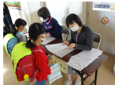
子どもたちの登校の様子

保護者の皆様と地域の皆様には、これまで同様に本校の教育活動へのご理解とご協力をよろしくお願いいたします。